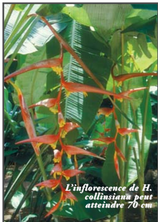
L'inflorescence de H. collinsiana peut atteindre 70 cm