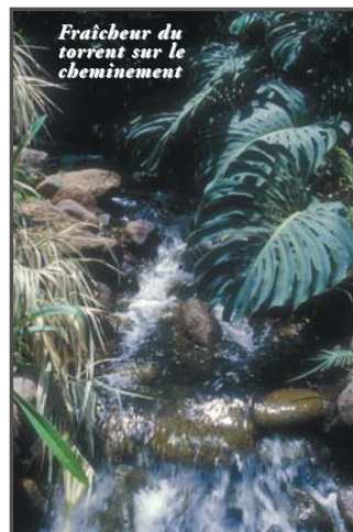
Fraîcheur du torrent sur le cheminement

Dans la palmeraie, un jeune "talipot pal" ( Corypha umbraculifera , Arecacées) d'une quarantaine d'années impose ses énormes palmes pesant plus de cinquante kilos. Il ne lui reste plus qu'une vingtaine d'années à vivre. Après une floraison inflorescentielle érigée, il dépérira, épuisé par cette ultime donation. Mais les jardiniers prévoyants lui ont acolé un descendant, garant de la pérennité.