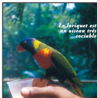
Le loriquet est un oiseau très sociable

Jardin Botanique de Deshaies (97126) T. 05 90 28 43 02 http://www.jardin-botanique.com