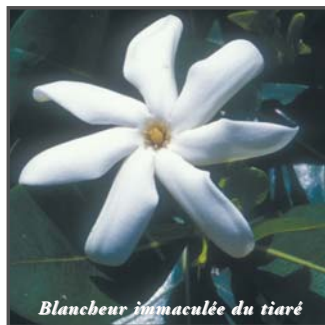
Blancheur immaculée du tiaré

La chute d'eau se fait de plus en plus proche. De dix mètres de haut, une masse se précipite, tumultueuse, dans un bassin créé de toutes pièces dont les enrochements artificiels semblent plus