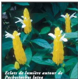
Éclats de lumière autour de Pachystachys lutea

Depuis une quinzaine d'années, le concept de jardin botanique tente de s'installer sur les départements français d'Amérique (DFA). L'omniprésence de la nature aurait-elle fait oublier que la connaissance des plantes, la sauvegarde d'espèces menacées, ou encore l'enrichissement du patrimoine floristique passent par ces lieux incontournables aux accents didactiques? Qu'il soit à vocation scientifique ou simplement d'ordre paysager, le jardin botanique trouve légitimement sa place, au même titre que le conservatoire, dans une perspective globale de notre environnement.