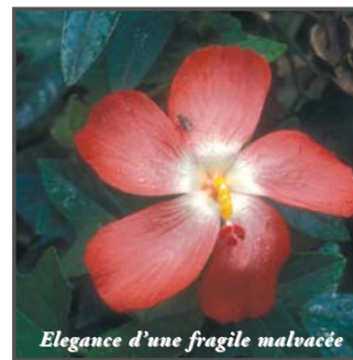
Elegance d'une fragile malvacée

Plus loin, la zone à cactées révèle des beautés comme ce Pachypodium lamerei (Apocynacées), originaire de Madagascar. Ses pétales d'un blanc immaculé s'opposent au vert luisant de son feuillage. Des Opuntias, agaves et autres aloés portent