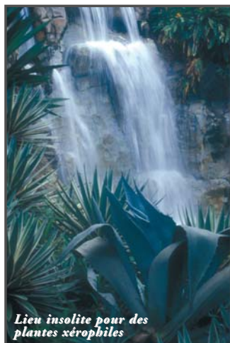
Lieu insolite pour des plantes xérophiles

Depuis une quinzaine d'années, le concept de jardin botanique tente de s'installer sur les départements français d'Amérique (DFA). L'omniprésence de la nature aurait-elle fait oublier que la connaissance des plantes, la sauvegarde d'espèces menacées, ou encore l'enrichissement du patrimoine floristique passent par ces lieux incontournables aux accents didactiques? Qu'il soit à vocation scientifique ou simplement d'ordre paysager, le jardin botanique trouve légitimement sa place, au même titre que le conservatoire, dans une perspective globale de notre environnement.