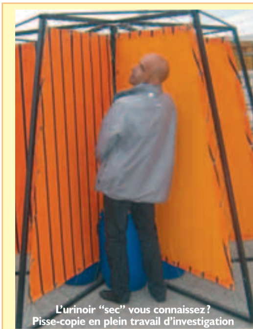
L'urinoir "sec" vous connaissez ? Pisse-copie en plein travail d'investigation