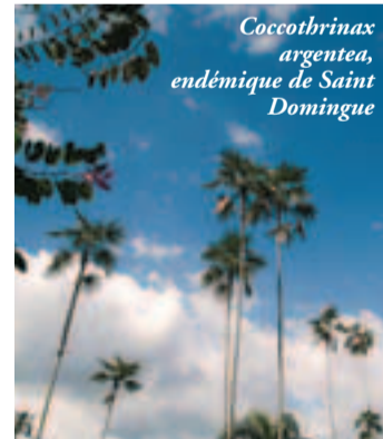
Coccothrinax argentea , endémique de Saint Domingue

LE JARDIN BOTANIQUE DE SAINT DOMINGUE un jardin plus vrai que nature. P. 31