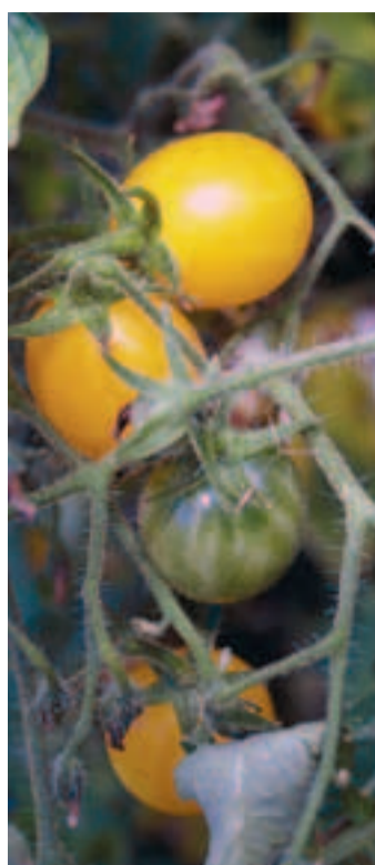
Plant et gros plan de tomate 'Groseille'